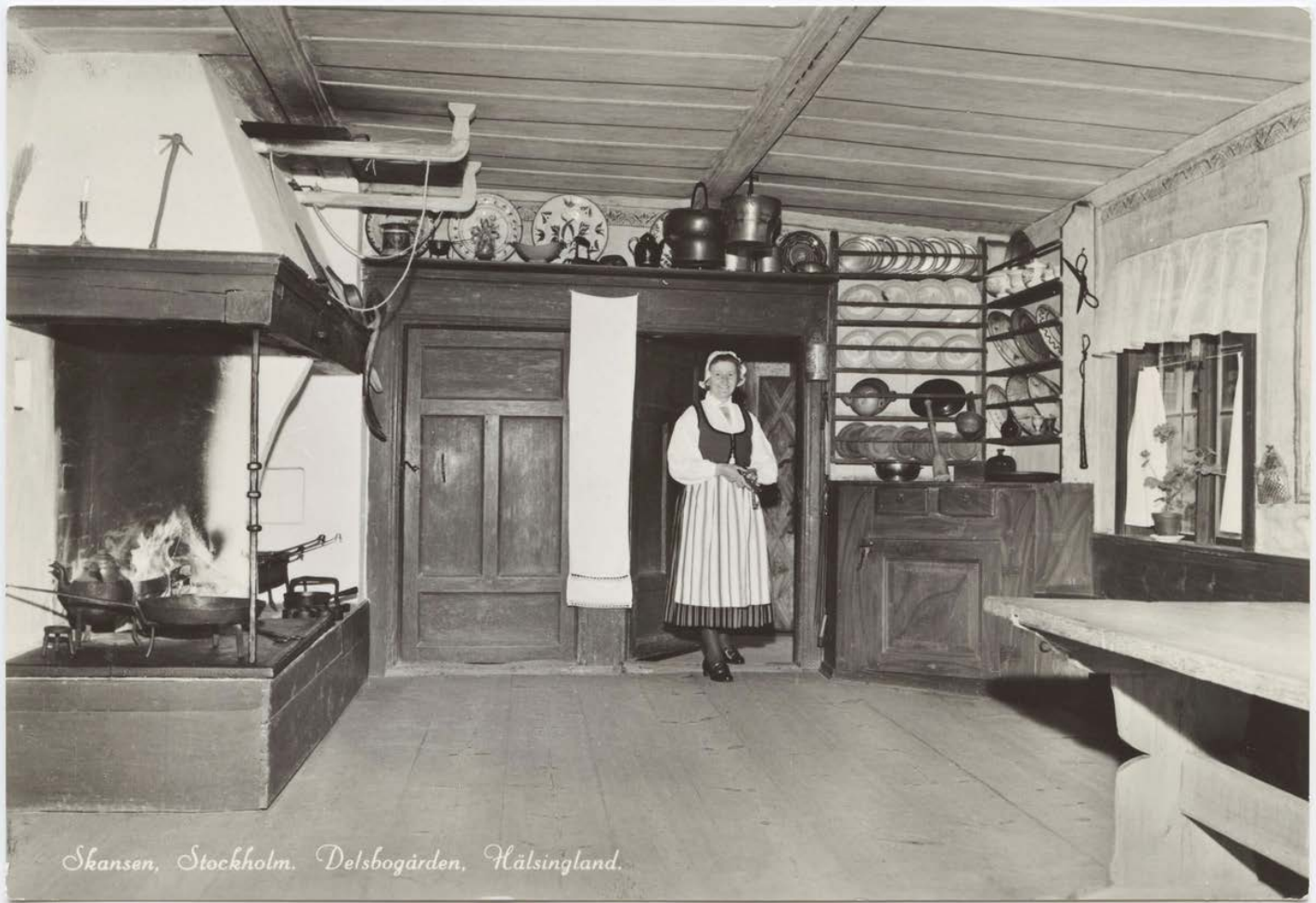
Vykort med motiv från Skansen. Interiör från Delsbögården, Hälsingland.