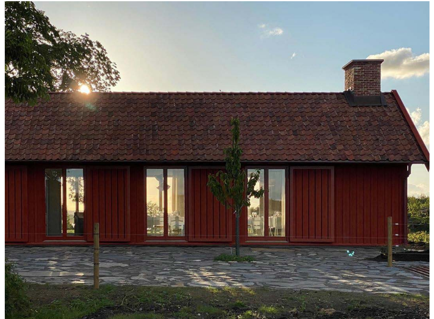
Nyuppfört sommarhus i Äggdal, Gert Wingårdh

Den gamla Glömstatugan går i graven för att ge plats åt den nya, och ett stycke historisk materia går förlorad. Överblivet friskt material återbrukas.