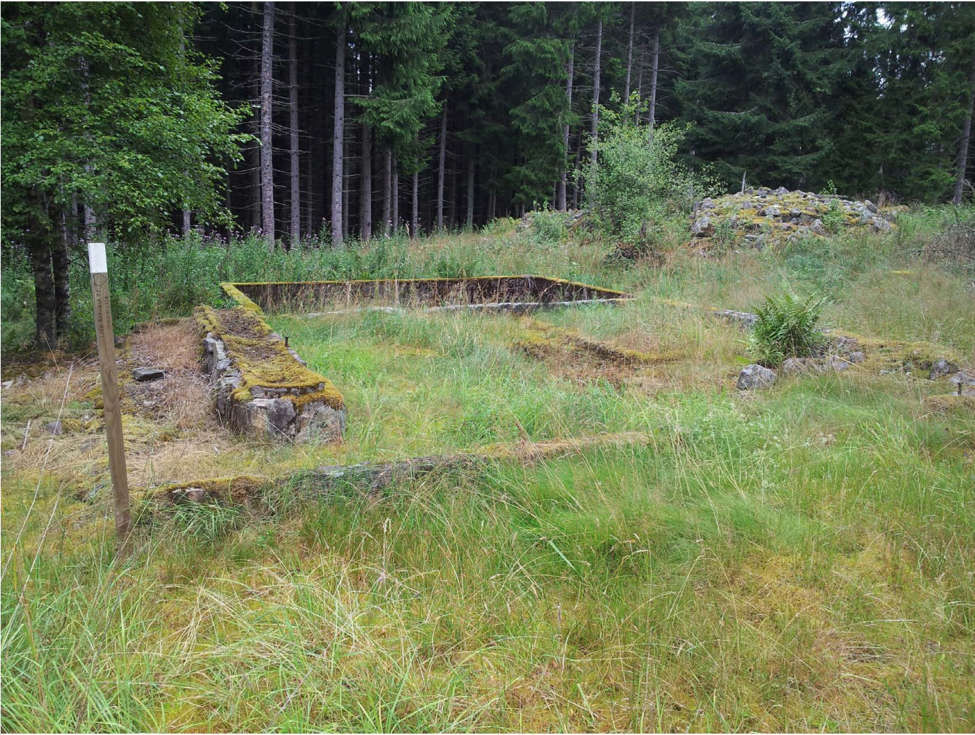
Torpgrund bevarad i naturen.

Om endast säteribyggnaden står kvar bland villorna i Glömsta är det lätt att tro att säteriet bara var en högre ståndsbostad. Genom att utradera säteriets ekonomibyggnader, startorp och landskap försvinner många socioekonomiska perspektiv på historien, och en del mindre av vårt samhällsskikt berättelser fortlever.