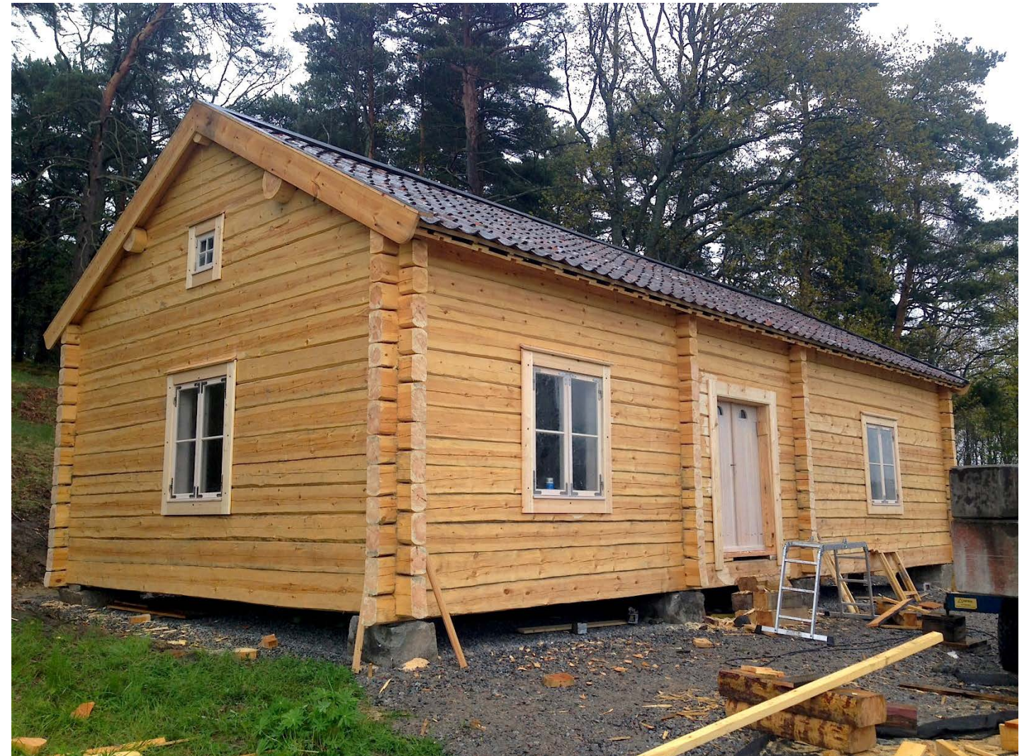
Parstuga enligt förlaga från tidigt 1800-tal.

Utan ett tydligt ställningstagande i tidigt skede riskerar en moderniserad rekonstruktion att ta genvägar och göra enkla lösningar istället för att respektera de kulturhistoriska värdena. Om inte avsikten är att återställa till ett specifikt skick så saknas en fast definierad målpunkt.