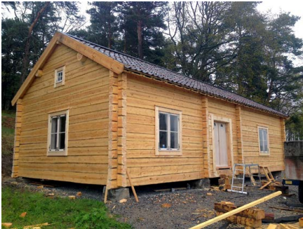
3. Moderniserad rekonstruktion