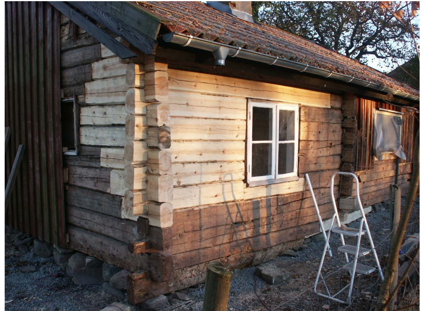
Timmerlagning i Lidköping.

Genom att rekonstruera så pass stora delar av stugan blir kanske endast en bråkdel av originalet kvar. Det vi ser är inte en faktiskt historisk miljö längre, utan en ambitiös iscensättning med vissa "äkta" komponenter.